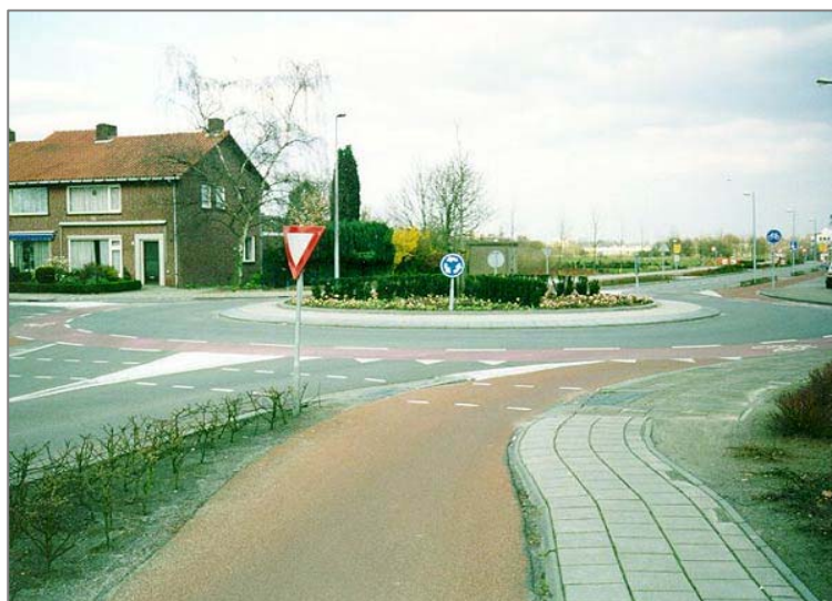
Foto: Vedení cyklostezky po okružním pásu OK Veldhoven

Vlastnosti a požadavky na kvalitní a funkční cyklistické prostředí je možné shrnout do pěti hlavních bodů 1 :