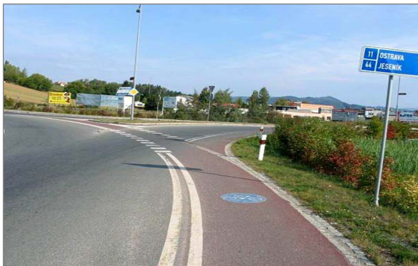
Foto: Vedení cyklostezky po okružním pásu OK v Šumperku