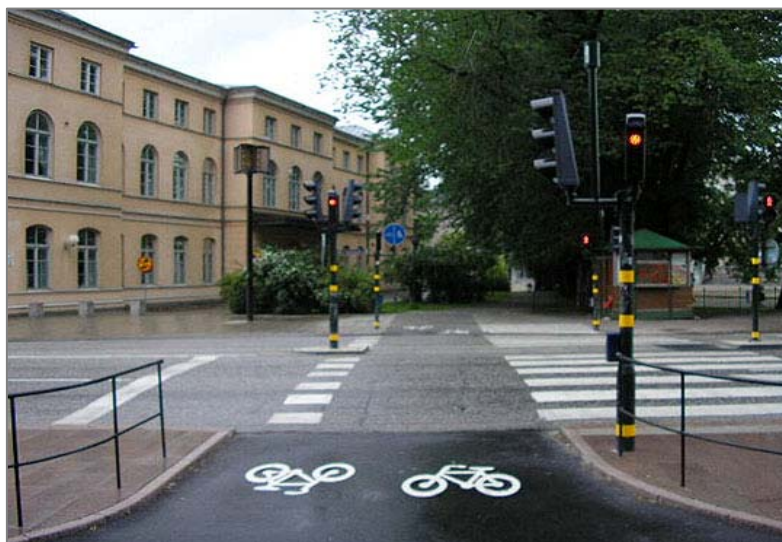
Foto: Křížení cyklostezky s pozemní komunikací s využitím SSZ, Kodaň

Zpracovávají jsou také další příklady řešení vedení cyklotras a cyklostezek. Infrastruktura cyklistické dopravy nepředstavuje pouze cyklostezky a cyklotrasy. Jedná se komplex technických a stavebních prvků (dopravní značení, stojany, technické a servisní zázemí, ubytovací kapacity atd.), které umožňují komfortní a bezpečné použití kola jako dopravního prostředku ať už pro přepravu do zaměstnání, sport či pro cykloturistiku.