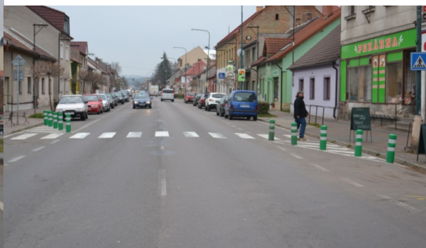
Obrázek 07. Směrové sloupky zelené kulaté - baliseta

Na obr. 08 je provedena grafická simulace osazení zelených flexibilních sloupků jako podpora zachování šířky průchozího prostoru chodníku v obci. Právě v těchto situacích spočívá hlavní ohnisko využití flexi sloupků. Sloupek vozidlo nepoškodí, ale klade dostatečný odpor, aby si řidič uvědomil, že najíždí do jemu zakázaného prostoru. Realizace balisety v tomto místě je sice možná, ale její profil by zbytečně zabíral cenné centimetry přidruženého prostoru komunikace v obci. Na obr. 09 je znázorněno vhodné použití balisety jako podpory vodorovného dopravního značení na silnici I. třídy mimo obec. Zelený sloupek s bílými odrazovými plochami vymezuje prostor určený pro dopravní stín.