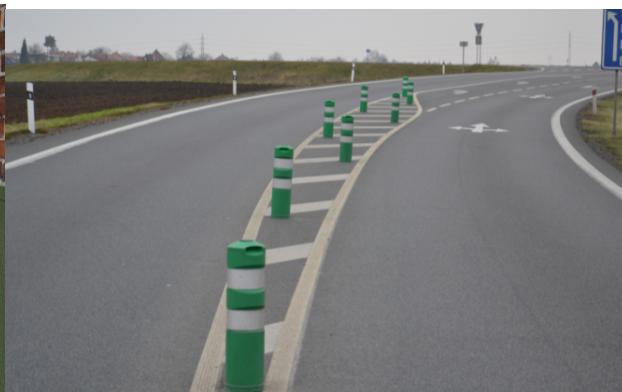
Obrázek 09. Směrové sloupky zelené kulaté - baliseta

V ČR doposud nebyl zpracován ucelený podklad (manuál) pro navrhování a umístování tohoto typu dopravně bezpečnostního a dopravně výchovného zařízení, které zvýrazňující regulační sloupky představují. Poznatky zde prezentované byly z části získané v rámci řešení VaV projektu „Implementace flexibilních sloupků jako prvků městského inženýrství“, na který poskytla účelovou dotační podporu Technologická agentura ČR v letech 2013 až 2015 s označením TA03030747. Hlavním výsledkem projektu byla „Metodika navrhování flexibilních regulačních sloupků“ [01], která je po registraci od prosince 2015 dostupná na projektových stránkách www.flexi.cdvinfo.cz .