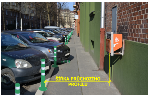
Obrázek 08. Flexibilní regulační sloupek - zelený

Na obr. 08 je provedena grafická simulace osazení zelených flexibilních sloupků jako podpora zachování šířky průchozího prostoru chodníku v obci. Právě v těchto situacích spočívá hlavní ohnisko využití flexi sloupků. Sloupek vozidlo nepoškodí, ale klade dostatečný odpor, aby si řidič uvědomil, že najíždí do jemu zakázaného prostoru. Realizace balisety v tomto místě je sice možná, ale její profil by zbytečně zabíral cenné centimetry přidruženého prostoru komunikace v obci. Na obr. 09 je znázorněno vhodné použití balisety jako podpory vodorovného dopravního značení na silnici I. třídy mimo obec. Zelený sloupek s bílými odrazovými plochami vymezuje prostor určený pro dopravní stín.