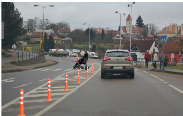
Obrázek 06. Flexibilní regulační sloupky - oranžové

Balisety jsou zde zvoleny jako podpora vodorovného dopravního značení, což je v souladu se vyhláškou č. 294/2015 Sb. [12], ale není v souladu s TP 58 [05]. Umístění baliset na obr 07. z pohledu vzdálenosti od přechodu je nedostatečné. Pokud jsou balisety umístěny jako podpora rozhledu, měly by vymezit prostor pro rozhled ve vzdálenosti 5 m před přechodem, aby zabránily nelegálnímu zastavení vozidel na přechodu a před přechodem dle odstavce (c) § 27 zákona č. 361/2000 Sb. [09].