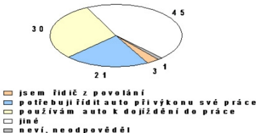
Graf č. 1: Typy řidičů (v %)

Vyškolení tazatelé prováděli sběr dat prostřednictvím dotazníku.