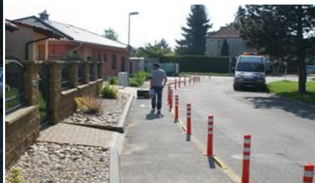
Obrázek 11. Břeclav – krátce po osazení

Pohyb chodců zůstal zachován na vymezeném prostoru. Do odděleného prostoru se přesunuli i cyklisté (v navazující ulici za křižovatkou je pro ně vyhrazený jízdní pruh a vznikla tak návaznost trasy). Reakcí rezidentů a majitelů přilehlých nemovitostí byl spíše údiv. Padlo pár předpovědí: „Tohle tady nemůže přece přežít.“ Opak je pravdou. Všechny sloupky přešly monitorovací období bez úhony pouze s drobnými oděrkami na exponovaných místech (odstraněn byl pouze jeden sloupek, který majitelům přilehlé nemovitosti překážel ve vjezdu – ovšem až po 11 měsících provozu). Nejvíce trpěly krajní sloupky a sloupky po krajích vjezdů. Místa byly strženy reflexní pásy, ale jinak dopravní a klimatické zatížení nemělo žádný vliv na tvar nebo funkci sloupků.