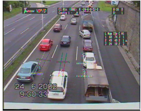
Obr. 5 Schéma a základní reálný videoobraz sledovaného odbočování

Zde je patrné jak vratná rampa pro kterou nestačí odbočovací pruh způsobuje „zahlcení“ pravého jízdního pruhu a tento vliv se postupně přenáší na ostatní jízdní pruhy (jak deklarují grafy závislostí), vozidla, která nechtějí čekat, odbočují až v bezprostřední blízkosti rampy tj. ze středního jízdního pruhu.