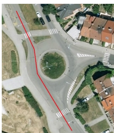
obr. 03. Nevhodně navržená OK - možný přímý průjezd