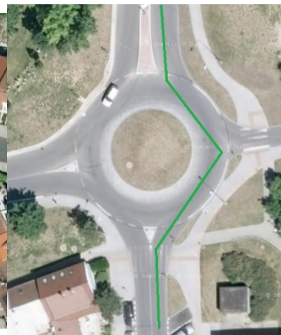
obr. 04. Vhodně navržená křižovatka

OK s vyššími hodnotami úhlu na přímém průjezdu \omega (viz obr. 04) vyvolávají snížení rychlosti vozidla, tím dojde k úpravě odstupů vozidel a jejich vyšší využitelnosti při zařazování vozidel z jiných směrů. Dojde tak ke zvýšení propustnosti křižovatky a zároveň ke zvýšení bezpečnosti vlivem nízkých