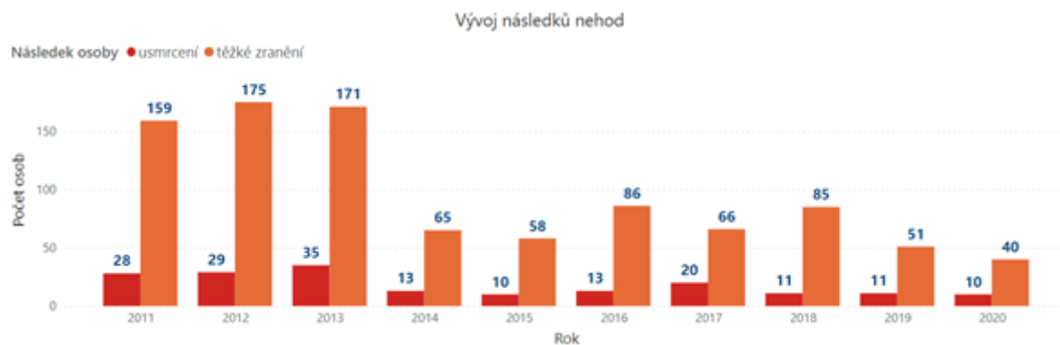
Graf 2 Vývoj závažných následků nehod vzniklých v důsledku vlivu námrazy, sněhu či náledí

Z hlediska regionálního rozložení je možné konstatovat, že k největšímu počtu nejzávažnějších nehod v letech 2011-2020 došlo ve Středočeském kraji (193). Nejvíce úmrtí v důsledku nehod vlivem námrazy, sněhu či náledí bylo evidováno v Jihočeském kraji (29).