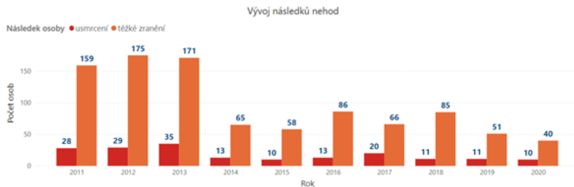
Graf 2 Vývoj závažných následků nehod vzniklých v důsledku vlivu námrazy, sněhu či náledí

Z hlediska regionálního rozložení je možné konstatovat, že k největšímu počtu nejvážnějších nehod v letech 2011-2020 došlo ve Středočeském kraji (193). Nejvíce úmrtí v důsledku nehod vlivem námrazy, sněhu či náledí bylo evidováno v Jihočeském kraji (29).